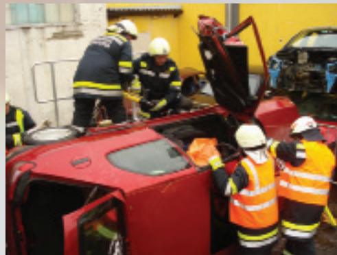
Die Florianiübung fand 2014 in Schwadorf statt.